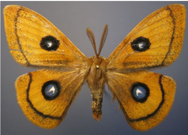
Fig. 1. Ejemplar ♂ de A. tau de Ancares, LOU-Arthr 1555.

mense Gómez-Bustillo & Fernández Vidal, es un sinónimo de A. tau , sin mayor discusión.