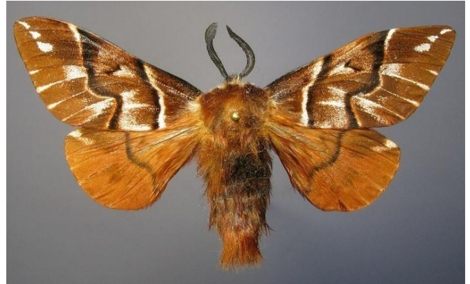
Fot. 1. Hábito del ejemplar objeto de esta nota, LOU Arthr 10152. Otras imágenes en http://www.bigal.org/Boletín_BIGA/Boletín_BIGA6/IC_Endromis/index.html .